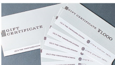
提供:京阪ホテルズ&リゾーツ

THE THOUSAND KYOTO及び京都セン チュリーホテルにてご利用いただける ギフト券3万円分 プレゼント!